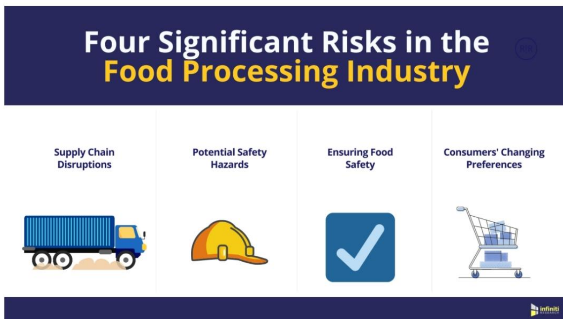
Fig. 2 – Quattro rischi significativi per l'industria agro-alimentare.