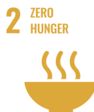
Fig. 4 Logo ONU ODD 2 (Obiectivul de Dezvoltare Durabilă 2 - Foamete Zero)

Deși discuțiile despre Dreptul la Hrană datează de mult, în ultimii ani, dreptul fiecărei persoane de a avea acces la alimente sănătoase și nutritive a fost reafirmat tot mai mult, în conformitate cu dreptul la nutriție adecvată și dreptul fundamental al fiecărei ființe umane de a nu suferi de foame. În 2015, Națiunile Unite au adoptat Agenda 2030, al cărei al doilea obiectiv este „Dezvoltare durabilă – Zero Foame până în 2030”, având ca scop ambițios eliminarea foametei la nivel global până în 2030.