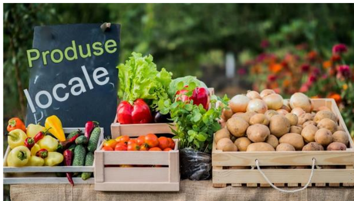
Figura 3 - Produse locale

parteneriatele cu fermierii locali. Această schimbare sprijină producătorii locali și reduce dependența de lanțurile internaționale de aprovizionare.